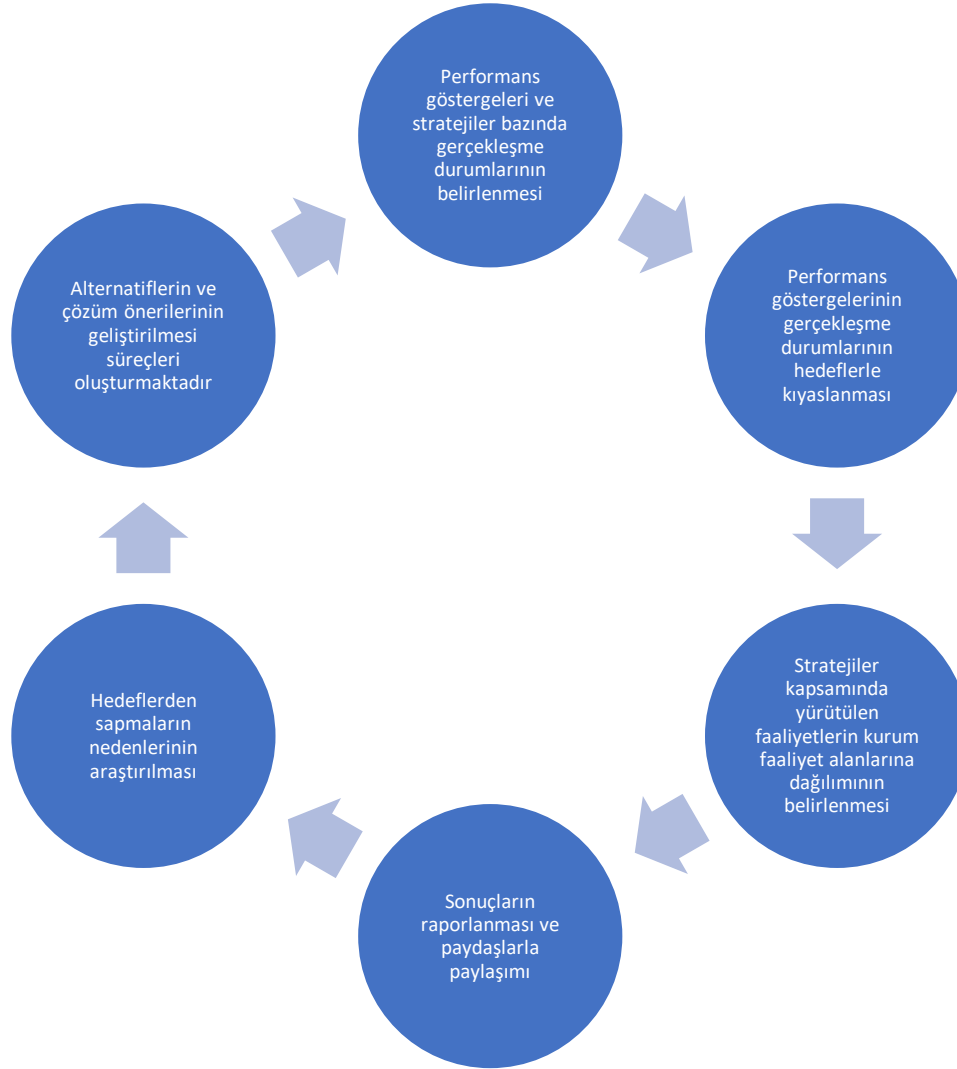
Şekil 1: İzleme ve Değerlendirme Süreci